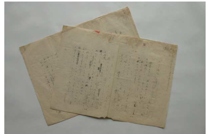
資料の例(手書き原稿)

整理を終えた資料は、痛みが進まないよう、中性紙の封筒や箱に入れ、一定の温度・湿度に保たれた通気性の良い環境で保存します。