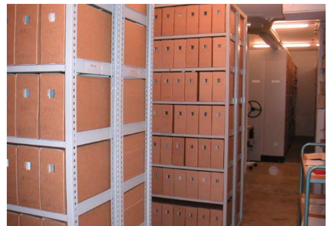
中性紙箱が並ぶアーカイブ書庫イメージ