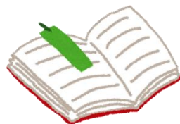
同時アクセス1の本